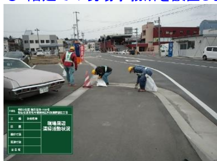
◎現場周辺の清掃活動をしました。