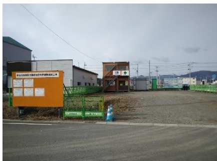
◎2階建ての現場事務所を設置しました。