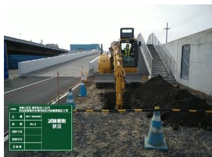
◎土を採取して試験を行いました。