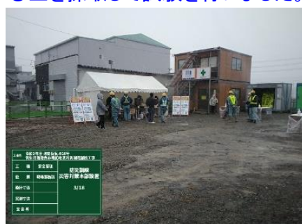
◎避難訓練を実施しました。