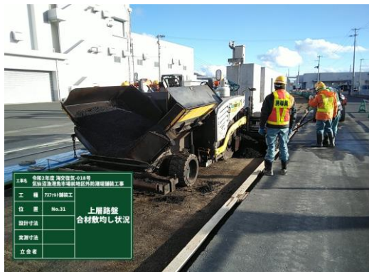
◎1層目の舗装をしています。