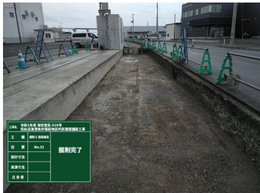
◎魚市場様出入口の掘削が完了しました。