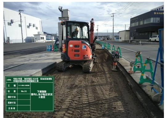
◎砕石で下層路盤を均しています。