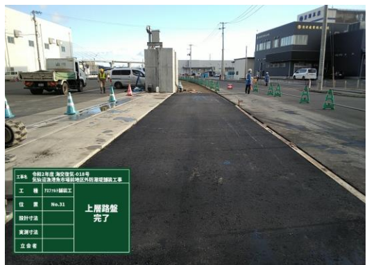
◎1層目の舗装が完了しました。